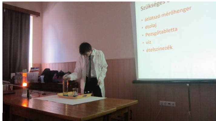
A kutatás eredményeinek bemutatása