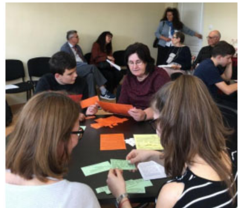
Az elkészített játékok kipróbálása