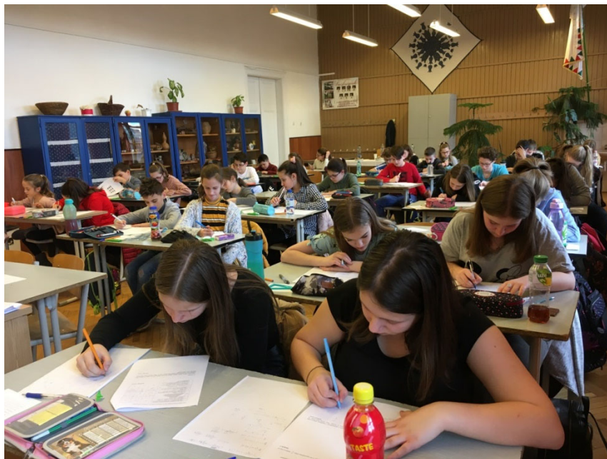
Területi döntő, Körmend

Honlap: www.curiealapitvany.hu E-mail: curieversenyek@gmail.com