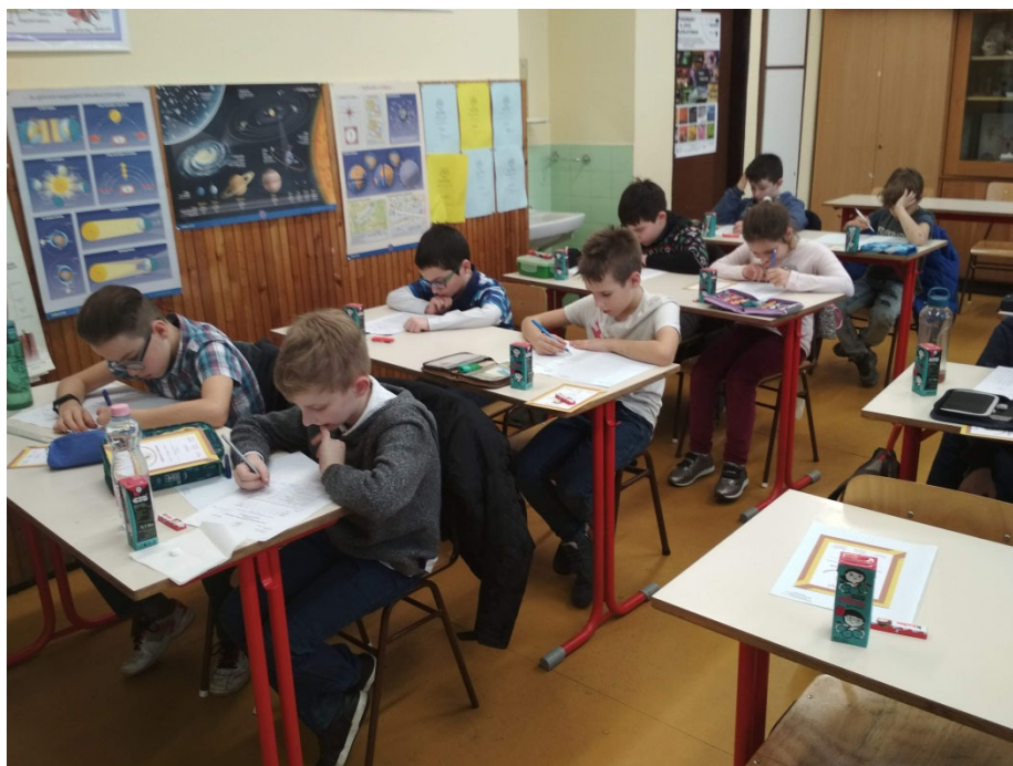
Területi döntő, Szeged