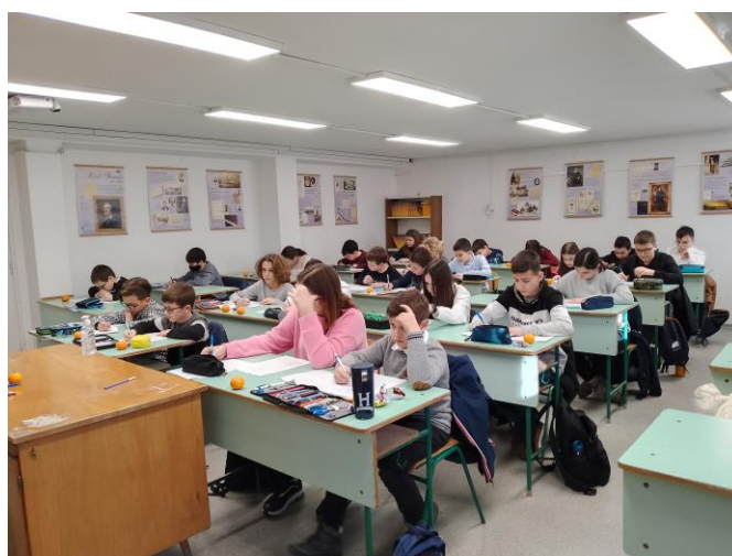
Területi döntő a szolnoki területi központban

A területi döntőket lehet válogató versenynek nevezni, ahová azon jelentkezők többsége eljut, akik mind a 3 forduló feladatsorát beküldték. Mindenhol ugyanazokat a feladatokat oldották meg, azonos javítókulcs alapján javítottak.