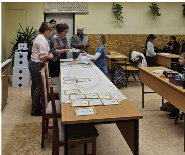
Területi döntő a hajdúszoboszlói területi központban