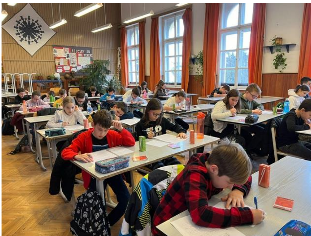
Területi döntő a körmendi területi központban

Folyamatosan tartottuk a kapcsolatot velük, a kulcsemberekkel személyes találkozásokat is szerveztünk a verseny zökkenőmentes lebonyolítása s a megfelelő színvonalú területi döntő megszervezése érdekében.