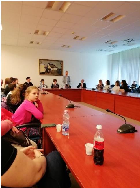
2024. április 26-i konferencia