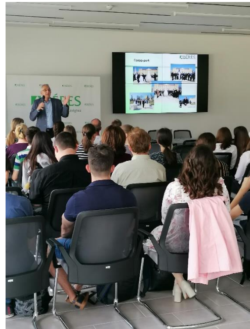
2024. május 10-i konferencia

Az 1. szakmai napot Debreceni Egyetem, Szolnok Campusán tartottuk, ahol a különböző helyekről érkezett szakelőadók részben természettudományos témában tartottak előadást, részben tehetséggondozással kapcsolatos előadásokat hallhattunk. A Magyar Tehetséggondozó Társaság elnöke „A tehetségigéret komplex fejlesztése: figyelemmel az erős és gyenge oldalakra is” címmel tartott előadást, valamint az Aggteleki Nemzeti Park bemutatására is sor került a záró rendezvény előkészítése céljából.